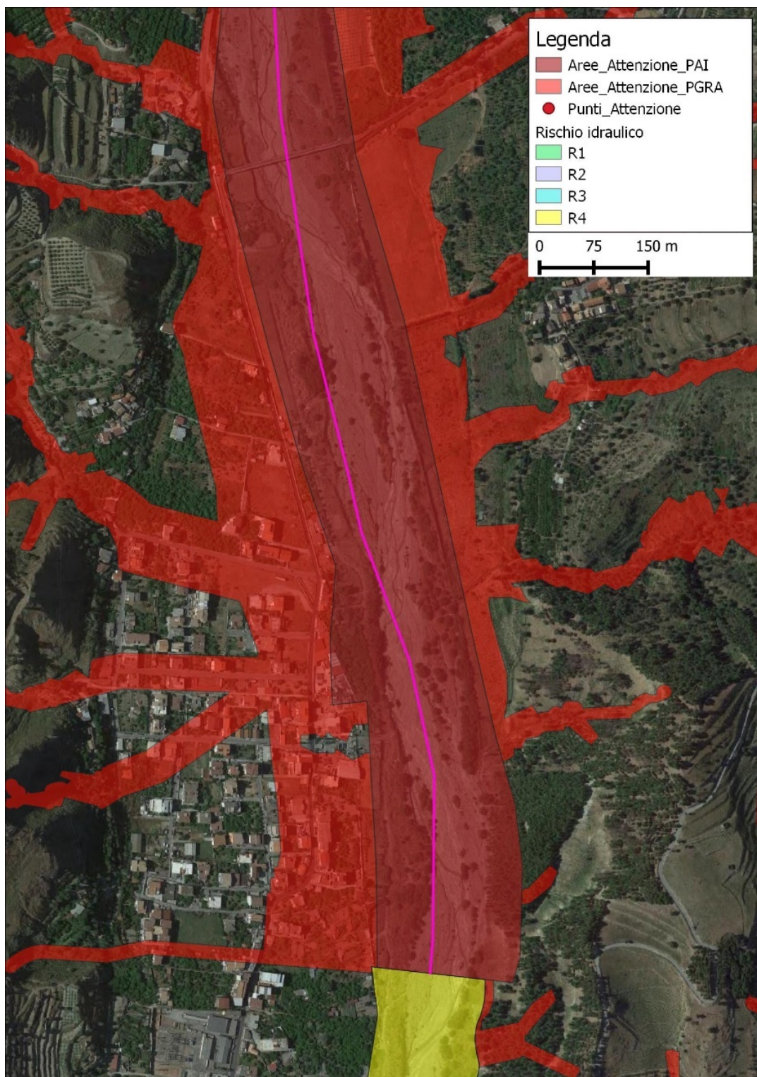
Piano Stralcio di Assetto idrogeologico dell'ex ABR Calabria - comune di Melito di Porto Salvo (RC) – Fiumara di Melito - Stralcio della mappa del rischio vigente